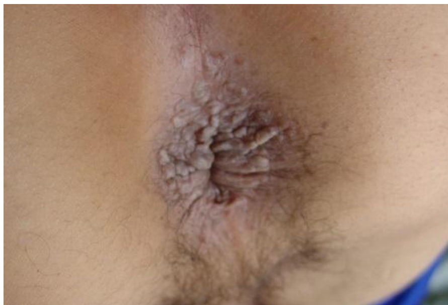
Figure 1: Lésions papulo-nodulaire lichénoïde et pseudo-condylomateuse prenant le pourtour de la marge anale