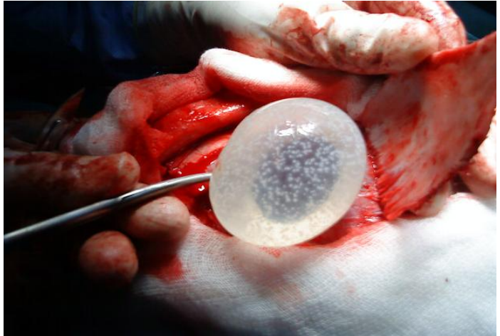
Figure 4: accouchement du kyste