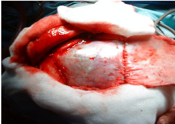
Figure 3: craniotomie