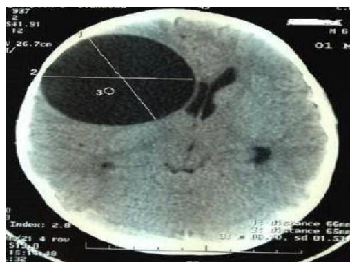
Figure 1: TDM d'un kyste hydatique cérébral de siège fronto-pariétal droit